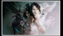
UNUSUAL & AVANTGARDE

Ein erstklassiger Katalog mit zahlreichen Farbabbildungen für alle Einsender!!! A marvellous catalogue of excellent printing quality will be sent to all participants!!!