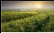
THE COMMODITIES OF BEER CULTURE