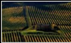
ALL ABOUT WINE