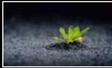
NATURE AND ENVIRONMENT