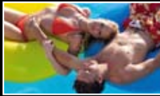
MY BEST HOLIDAY IMAGE