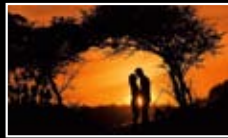
SUNRISE / SUNSET