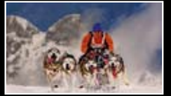
DYNAMICS / SPORTS