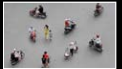
STREETS AND WAYS